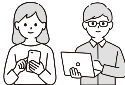
オンラインによる契約手続き