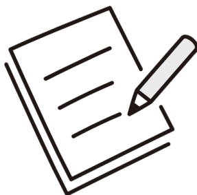
書面による契約手続き

不動産会社向けサービス「TeraWeb」に電子契約機能を実装することにより、ペーパーレスでシームレスな手続きが可能となります。