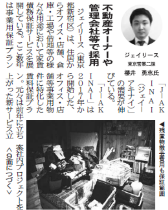
「JIAK I N A I」は、従来の同社の事業用商品と比較し保証内容が大幅に拡張し、幅広い用途での対応が可能となり、サービスの充実具合や対応力から、不動産オーナーや管理会社等から好評で採用率も高い。保も見られませんが、家賃保証の申込み件数は2019年3月期から2024年3月期まで増加している。