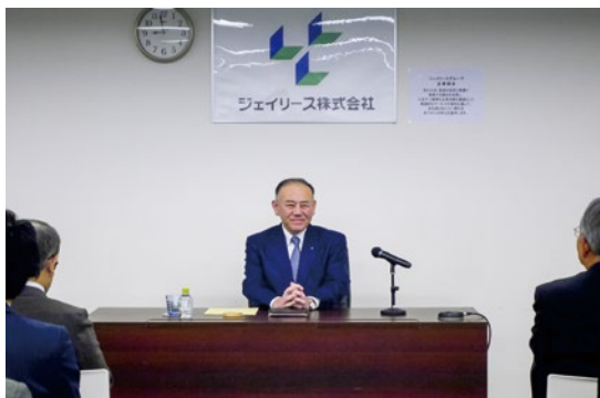
【社長近影/令和2年1月6日 大分本社にて】