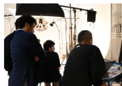
念入りにスチールのアグリチェック