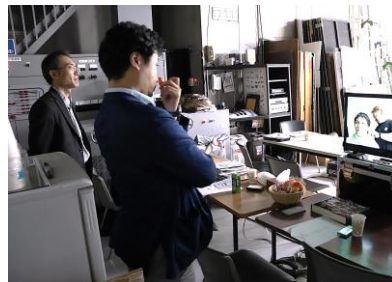
合成後のイメージを想像しながら確認