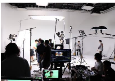
無機質な空間での撮影