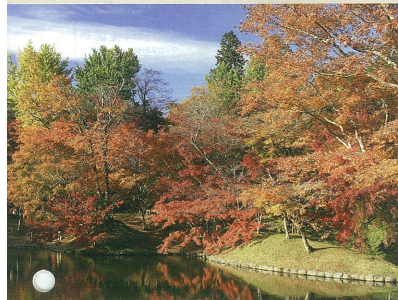
用作公園 (豊後大野市)

2014年の本紙発行は本号をもちまして終了いたします。 2015年は1月9日号からです。